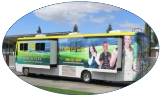
School Mobile Clinic