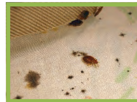
Las chinches adultas en una hoja con coloración típicas.